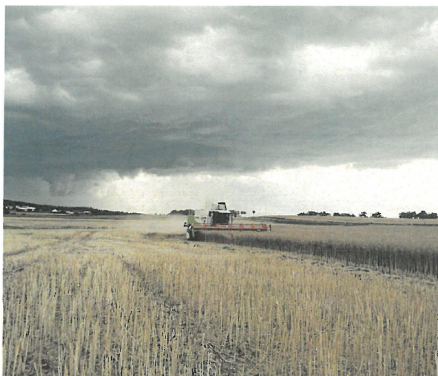
Chance nutzen und beim Klimafachtag 2026 wertvolles Wissen für eine klimafitte Zukunft abholen. LK 00