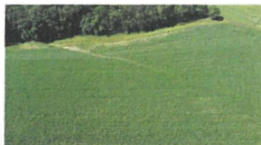
Die Digitalisierung für Boden und Wasser steht im Mittelpunkt bei der Tagung. BWSB

■ KR Ewald Mayr spricht über Digitalisierung im Ackerbau aus Sicht der Praxis.