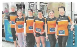
Die Fachschule Bergheim beteiligte sich erfolgreich am Osterlauf.

Kilometer- und Acht-Kilometer-Strecken wurden gut bewältigt. Allen Teilnehmerinnen war klar, dass sie nächstes Jahr auf jeden Fall wieder dabei sein wollen. Organisiert wurde der Lauf wieder vom Round Table 46, Eferding-Donautal.