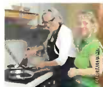
Bäuerinnen sind Profs, wenn es um regionales Kochen geht.

und Köchinnen wurden den Teilnehmerinnen verschiedene Gerichte vorgestellt. Zudem gab es Tipps und Tricks rund um die Zubereitung. Dabei lag der Fokus auf der Verwendung von regionalen Produkten und saisonalen Zutaten, um den Geschmack und die Qualität der Gerichte zu optimieren. Eine Vielzahl von Gerichten wurden zubereitet, darunter eine Erdäpfel-Käse-Most-Suppe, Veggie-Burger, pikante Gugelhupfe und verschiedene süße Desserts.