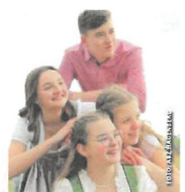
Hagenberger Schüler freuen sich auf zahlreiche Besucher.