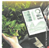
Die Digitalisierung in der Landwirtschaft schreitet voran.

Weitere Informationen auf der Website https://mehrwert-landwirtschaft.at/agrarische-fachtagung-2024/