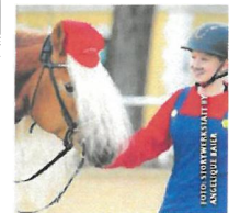
Auch Super Mario ist in Lambach zu sehen.

Nähere Informationen auf www.abzlambach.at