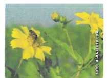
Die Webinarreihe startet am 18. April.

Eine Webinarreihe zum Thema „Überlebe in der Biodiversitätsfläche!“ wird angeboten. Kuriose Begegnungen mit Insekten und Gespräche unter Heuschrecken – dies und mehr gibt es bei den Webinaren am: Do., 18. April, Mo., 22. April, Do., 25. April, Mo., 27. Mai, Di., 28. Mai, 19 bis 20.45 Uhr; Kursbeitrag: 20 Euro (mit Betriebsnummer). Anmeldung: oekl.at/webshop/veranstaltungen/