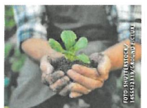
Bio-Jungpflanzentag am 20. April in Linz.

Am Samstag, dem 20. April 2024, von 9 bis 16 Uhr öffnet der OK Platz in Linz seine Türen für Bio-Freunde und Hobbygärtner. Mehr als 200 Sorten Gemüse- und Blumenpflanzen von Bio Austria Bäuerinnen und Bauern warten darauf entdeckt zu werden. Auch für kleine Gäste ist bestens gesorgt. Zudem gibt es regionale Bio-Leckereien und entspannende Live-Musik.