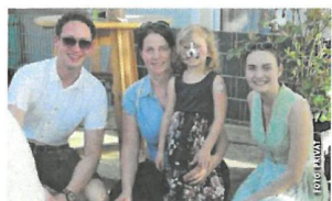
Der Spaß kam natürlich nicht zu kurz – auch für die Kleinen gab es ein Programm.